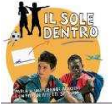
Il Sole Dentro